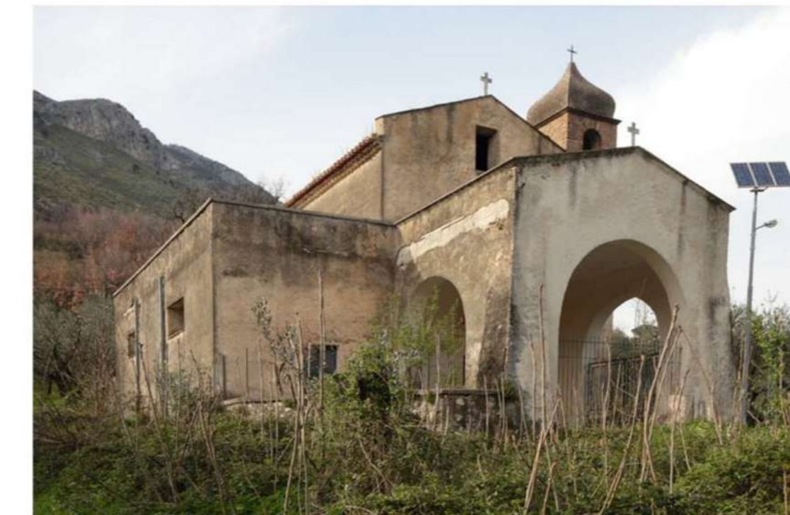
4. CHIESA DI SAN LORENZO (Loc. Campo)