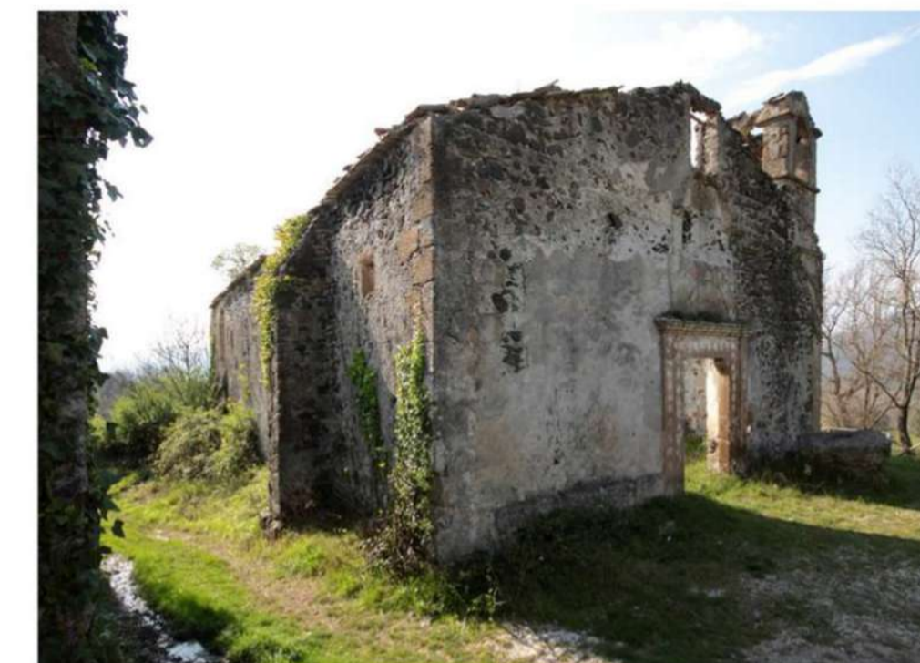
7. CHIESA DI SAN DONATO (Loc. San Donato)