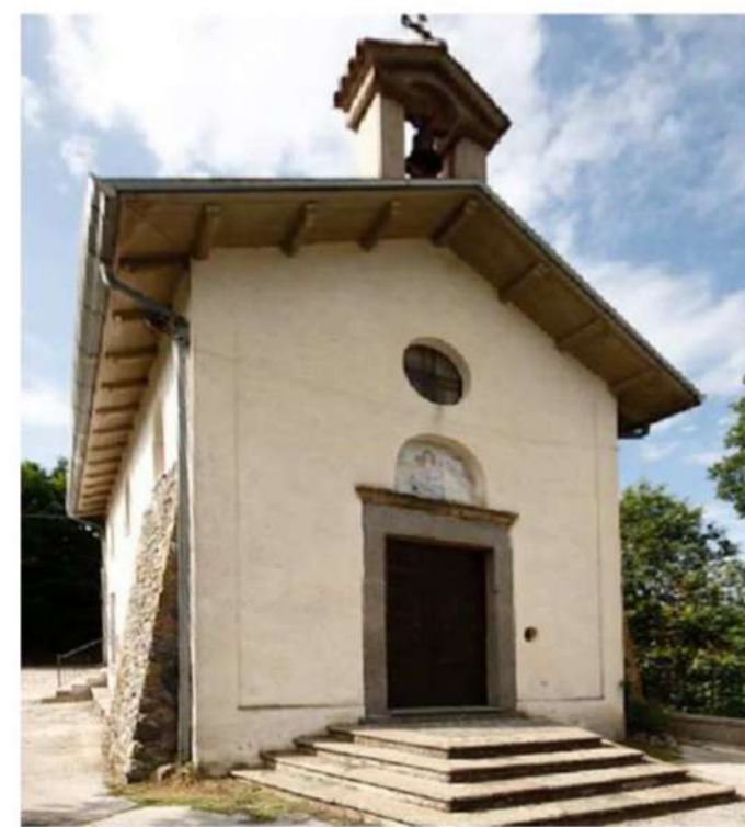
9. CAPPELLA MADONNA DEL SORBELLO (Loc. Ceci)