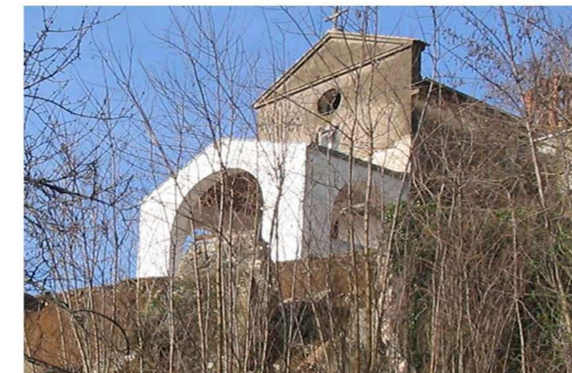
8. CHIESA DI S. MARIA DEL CASALE (Loc. Cinque Pietre di Calabritto)