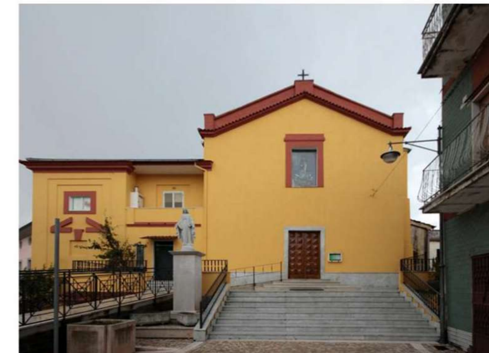
3. CHIESA DI SAN CLEMENTE (Loc. San Clemente)