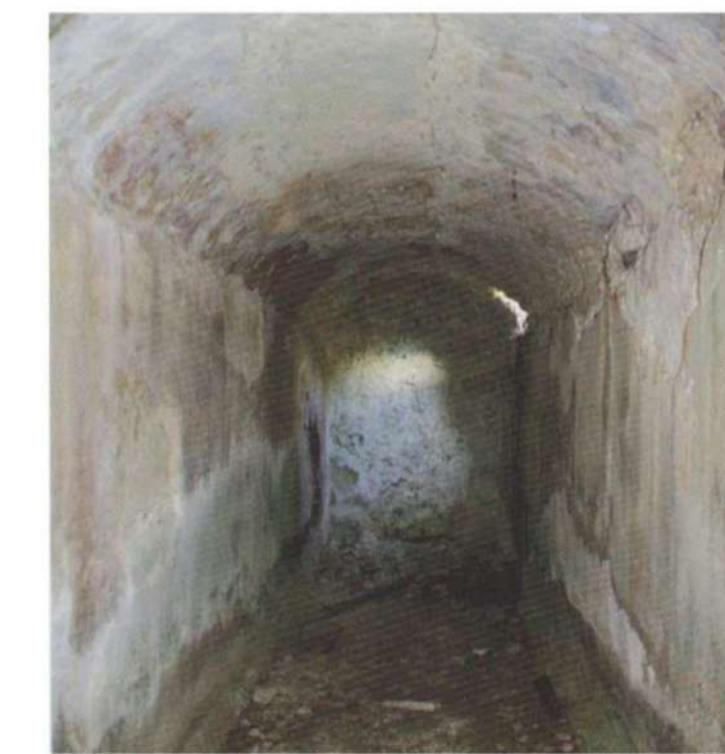
12. CHIESA DI SAN NICOLA (Loc. Cisterni)