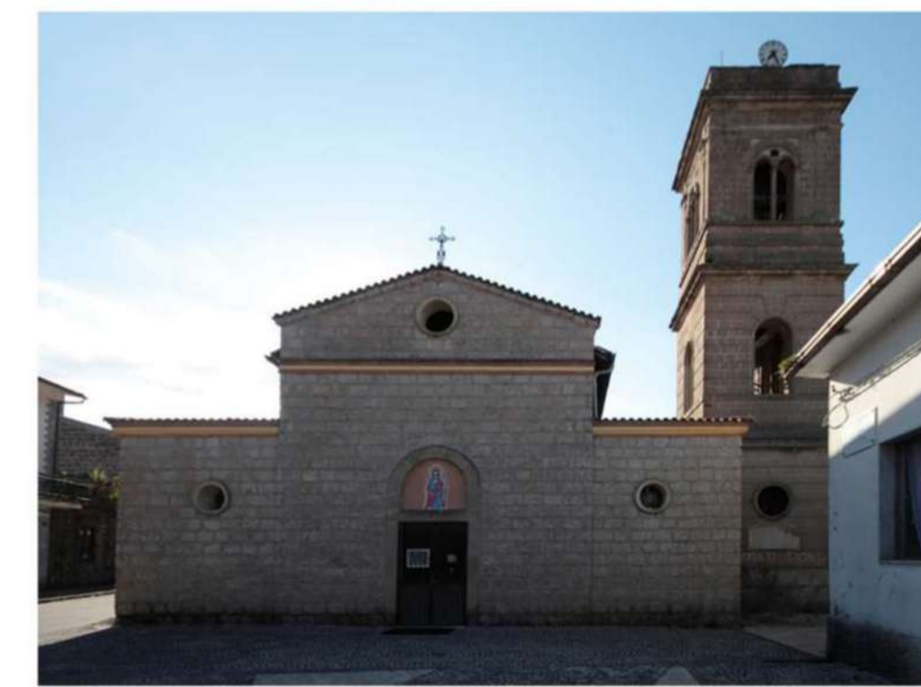
11. CHIESA DI SAN GIACOMO APOSTOLO (Loc. Vaglie)