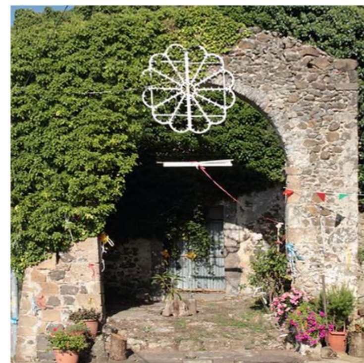
6. CHIESA DI SAN BARTOLOMEO (Loc. Martoni di Sipicciano)