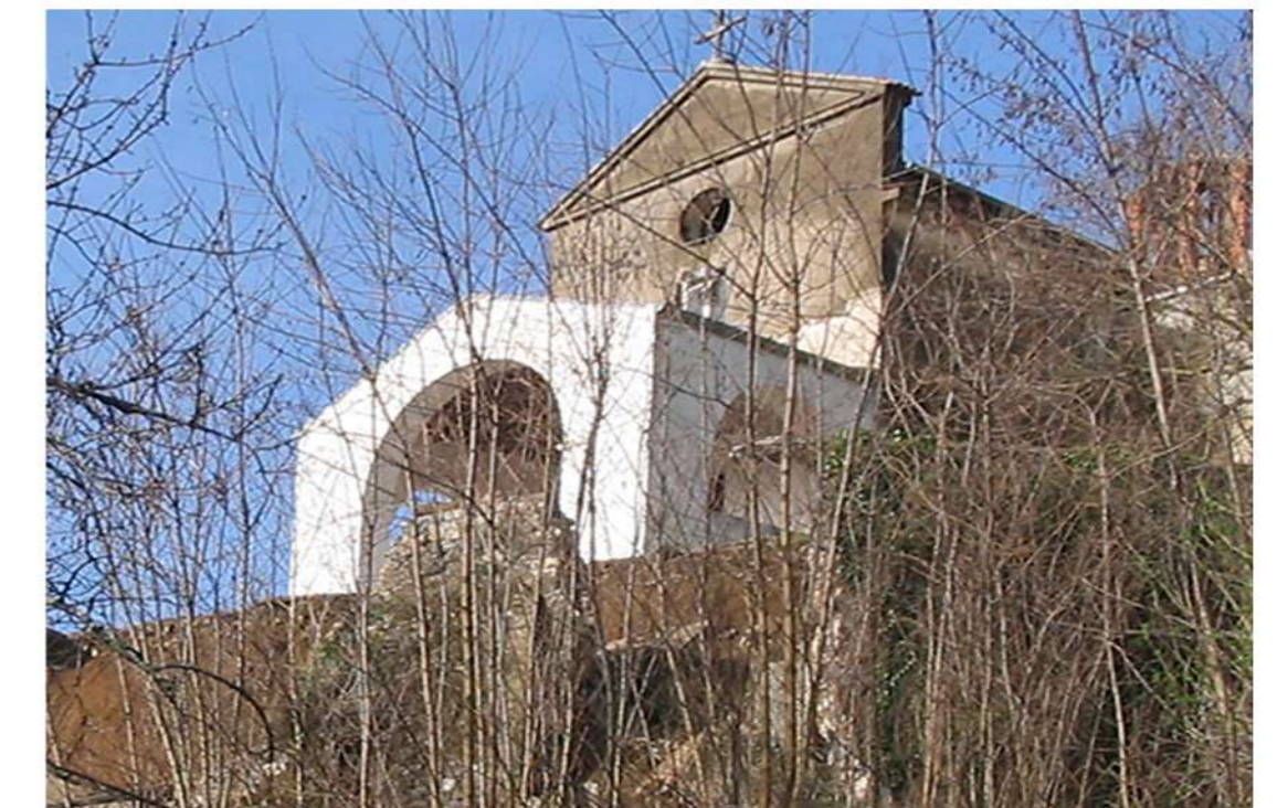
8. CHIESA DI S. MARIA DEL CASALE (Loc. Cinque Pietre di Calabritto)