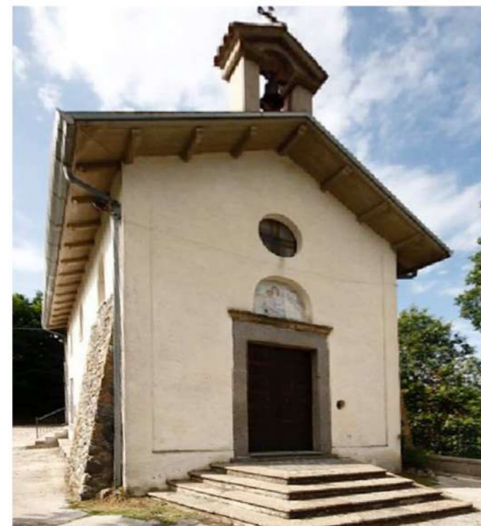
9. CAPPELLA MADONNA DEL SORBELLO (Loc. Ceci)