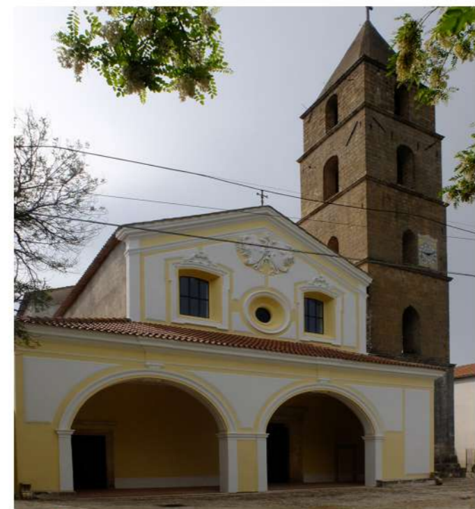
1. CHIESA DI S. STEFANO PROTOMARTIRE (Loc. Galluccio)

Collab./Resp. editing: Arch. E. MALASOMMA Tr. G.VIGLIOTTI