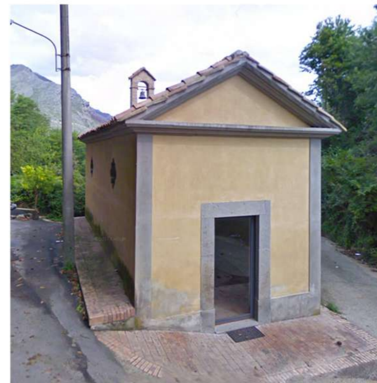
10. CAPPELLA DI S. MARIA DELLE GRAZIE (Loc. Cisterni di Galluccio)