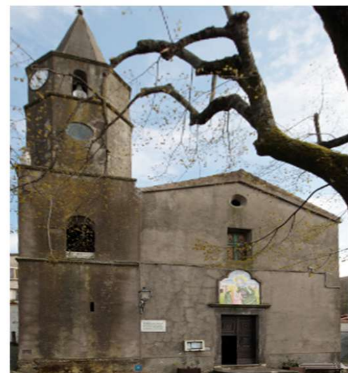
5. CHIESA DI S. MARIA DEL TRIONFO (Loc. Sipicciano)