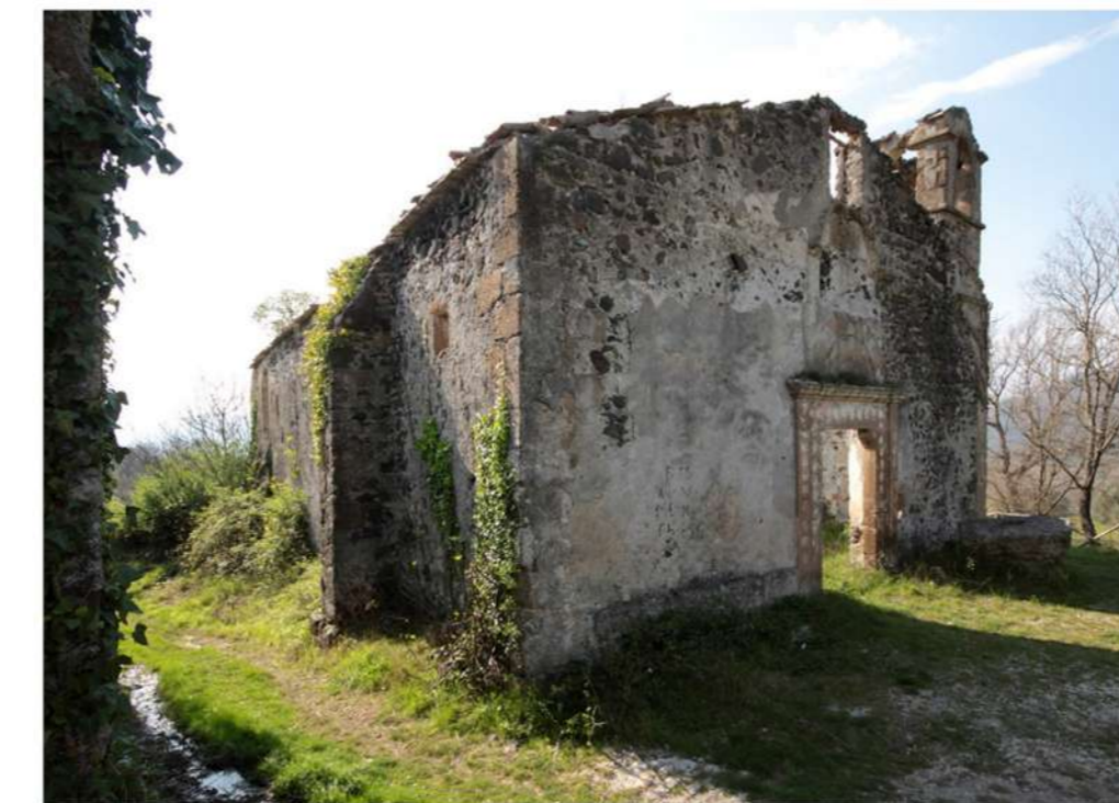
7. CHIESA DI SAN DONATO (Loc. San Donato)