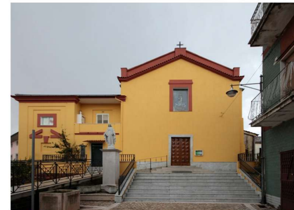
3. CHIESA DI SAN CLEMENTE (Loc. San Clemente)