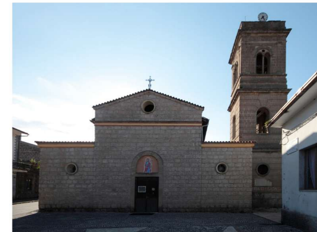
11. CHIESA DI SAN GIACOMO APOSTOLO (Loc. Vaglie)