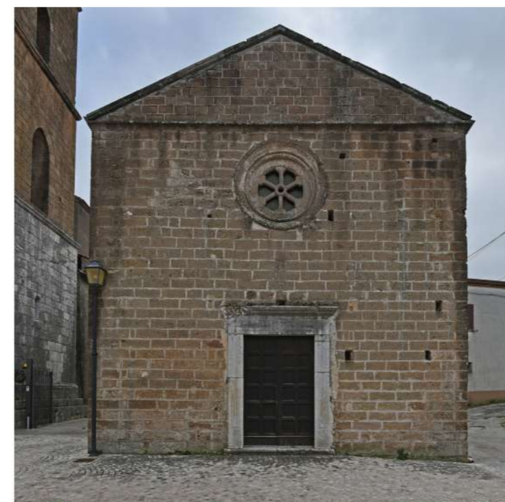
2. CHIESA DELL'ANNUNZIATA (Loc. Galluccio)