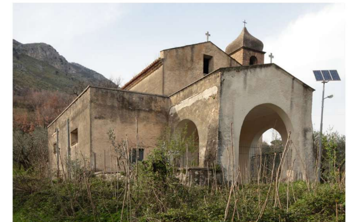
4. CHIESA DI SAN LORENZO (Loc. Campo)